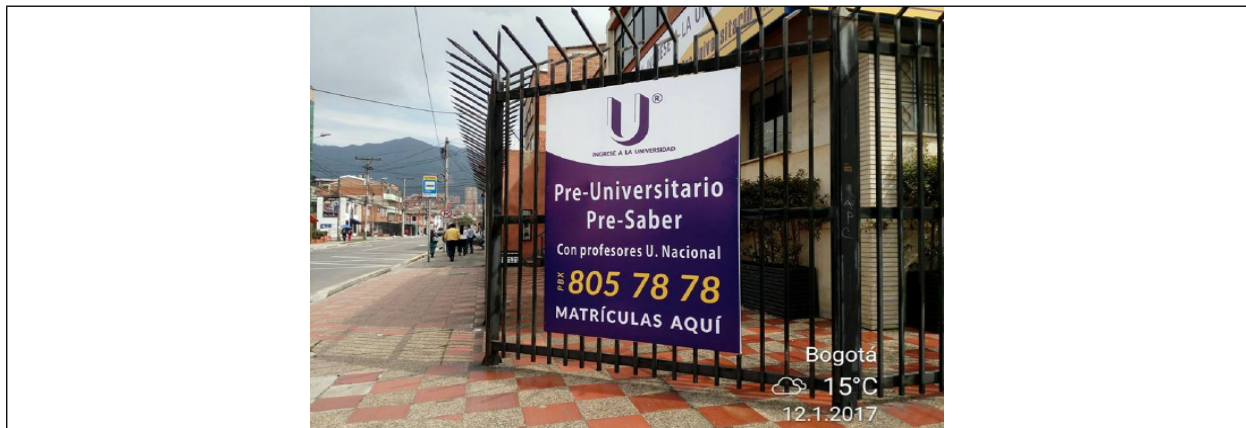
Fotografías No. 3: Aviso del establecimiento comercial CENTRO EDUCATIVO PASO A LA U, No cuenta con Registro de Publicidad Exterior Visual, ubicado en la Calle 52 No. 22 - 51.